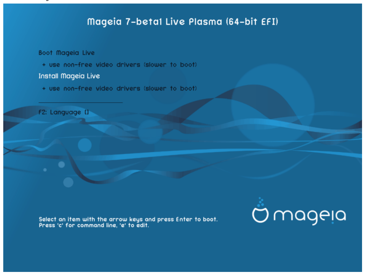
Ekrani fillestarë gjatë ndezjes në mënyrë të UEFI