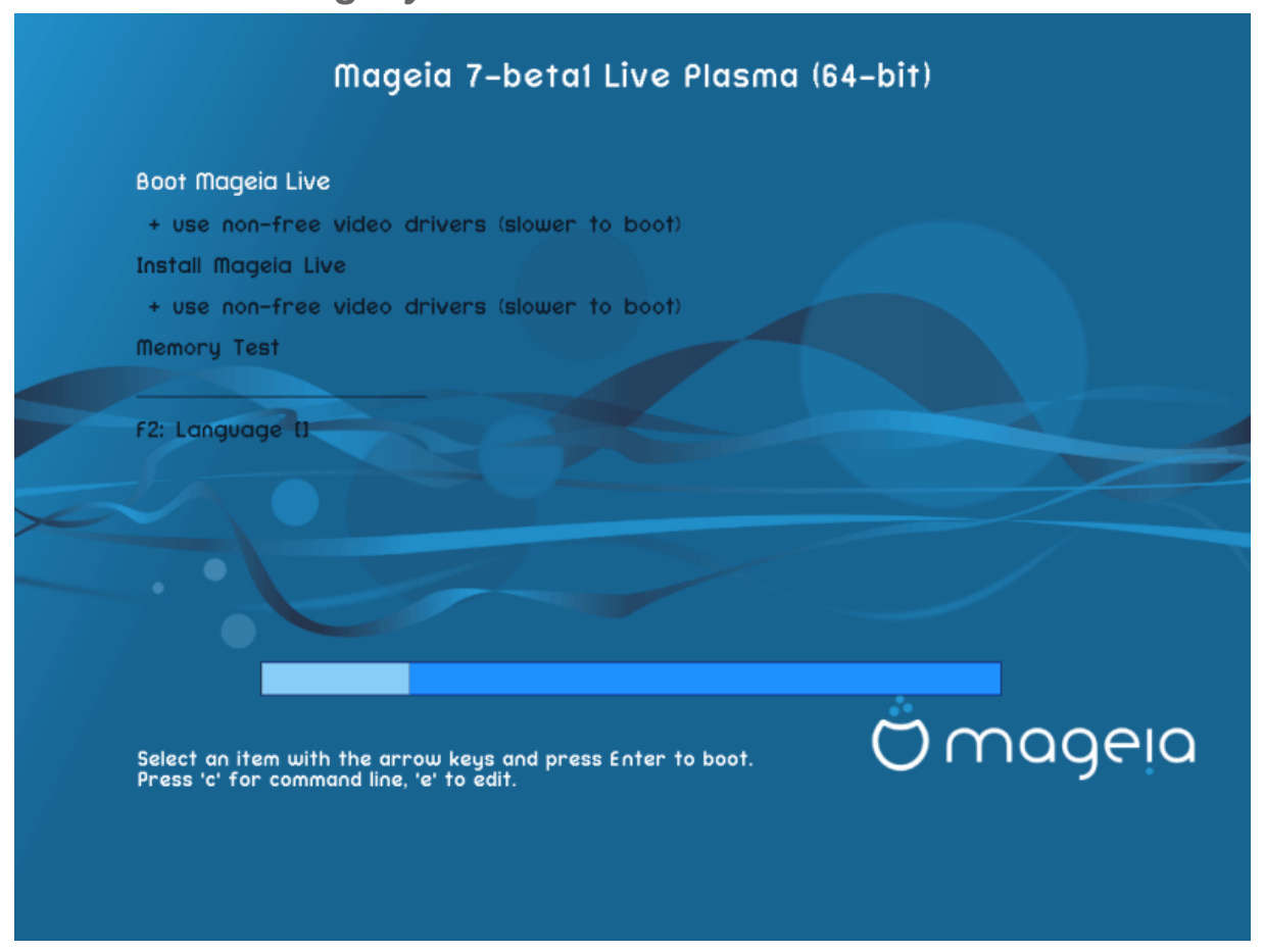
Ekrani fillestarë gjatë ndezjes në mënyrë të BIOS